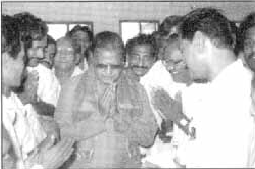
కళాశాలను సందర్శించిన ఆంధ్రప్రదేశ్ ముఖ్యమంత్రి కొ.శే|| ఎన్.టి.రామారావు

నలువైపుల నుంచి ప్రజానీకం ఎన్నో వాహనాల్లో స్వచ్ఛందంగా సొంత ఖర్చులతో సునామిలా తరలివచ్చారు. ఆయన చెప్పిన అద్భుత ఉపన్యాసం ఆంగికంగా, వాచికంగా అందర్నీ అలరించింది. ఆయన పల్లె పల్లె చైతన్య రథంపై తిరుగుతున్న సమయంలో వయసు హోదాలు మరచి పిల్లా జల్లా ముసలి ముతకా అందరూ ఆయన వాహనం వెంట పరుగెత్తుతుంటే అదో అద్భుత శకంలా ఆంధ్ర చరిత్రలో మిగిలిపోయే దృశ్యకావ్యం. అలా పసిపిల్లాడిలా పరుగెత్తిన అభిమానుల్లో ఒకడిగా రోజులు గుర్తుకు తెచ్చుకుంటుంటే అన్ని రంగాల్లోను విలువలు క్షీణించి నేడు మన రాష్ట్రము రాష్ట్ర ప్రజలు 'క్షీణయుగంలో' బ్రతుకుతున్నామన్న భావన హృదయాన్ని కలచివేస్తుంటుంది.